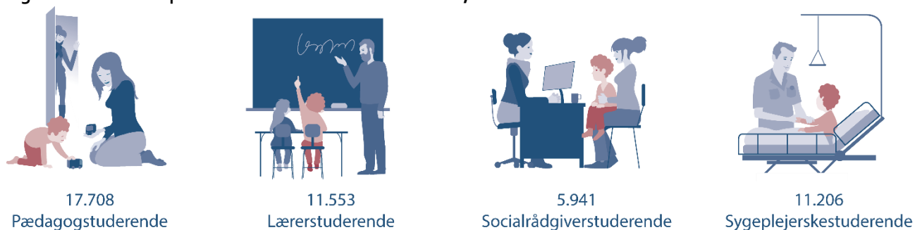
Figur 2. Studerende på de fire store velfærdsuddannelser, 2018